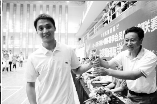
(第七名:中涛装饰代表队)