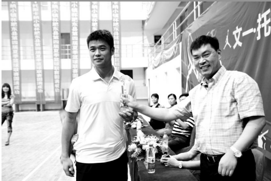
(第六名:深圳燃气代表队)