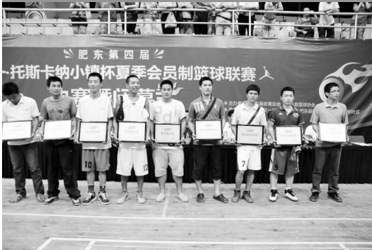
(优秀组织奖、体育道德风尚奖)