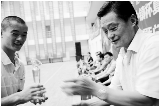
(亚军:炮兵学院代表队)