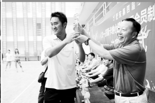
(第五名:肥东烟草公司代表队)