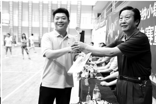
(季军:核动力健身代表队)