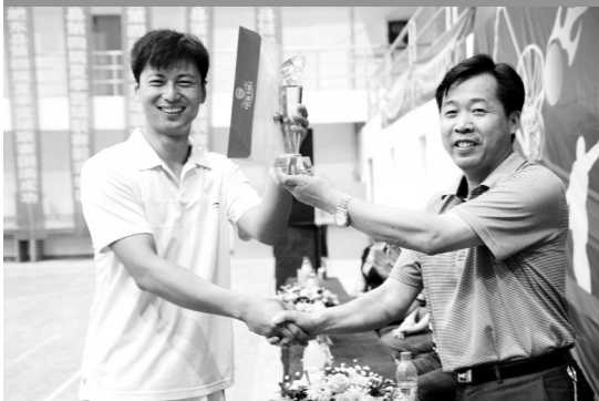
(第四名:肥东自来水厂代表队)